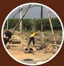
ตอกเสาเข็ม