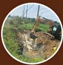
ขุดลอกคลอง