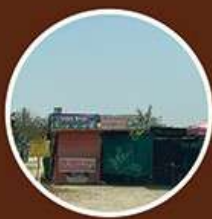
ปลูกสิ่งก่อสร้าง