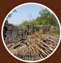
กองวัสดุ