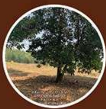
ปลูกไม้ยืนต้น